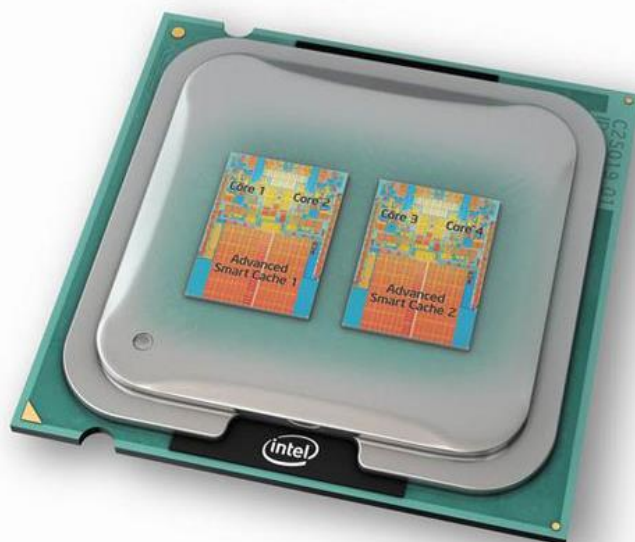
Figura 4 – Processador com 4 núcleos

Como exemplo, podemos citar a seguinte situação: o processador imita a lógica do cérebro humano. É evidente que o ser humano consegue fazer mais de uma coisa por vez ao mesmo tempo. Mas caso você necessite fazer uma tarefa que exija mais atenção e concentração, não é possível executar junta de outra. Por exemplo, não é possível lermos dois livros ao mesmo tempo. Assim funciona o processador. Quando ele possui mais de um núcleo, físico ou lógico, é como se ele tivesse dois cérebros no mesmo corpo, possibilitando a leitura desses dois livros simultaneamente. Assim fica fácil entender o funcionamento dos processadores com mais de um núcleo.