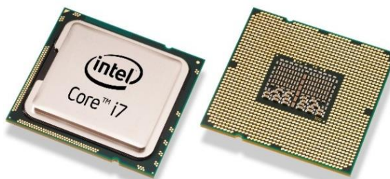
Figura 1 – Processador tipo soquete

O processador é conectado à placa-mãe através de um encaixe que pode ser do tipo soquete ou do tipo slot como vemos nas imagens abaixo.